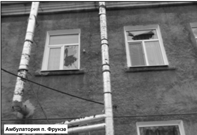
Амбулатория п. Фрунзе