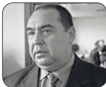
весны прошлого года, но я гарантирую, что республиканская пенсия будет выплачиваться, - пояснил глава ЛНР.

- Киев постоянно твердит о «территориальной целостности» и «единой Украине», но это не помешало ему лишить жителей Донбасса пенсий и социальных выплат, в очередной раз нарушив взятые на себя обязательства в рамках Минских соглашений. Пенсионеры не видели пособий от Украины с