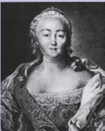
Императрицей Елизаветой Петровной был подписан указ о создании Славяносербии и поселении Славяносербских полков

Тяжелым было экономическое и правовое положение сербского населения и в Австро-Венгрии.