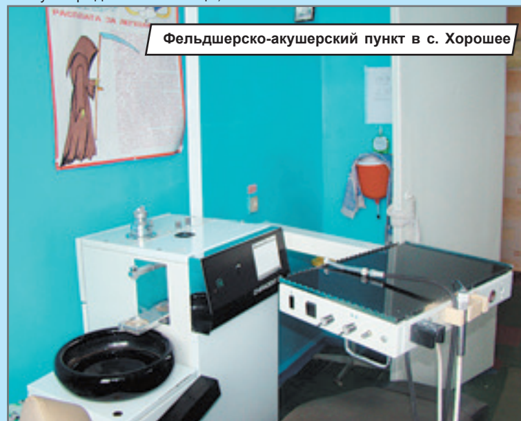
Фельдшерско-акушерский пункт в с. Хорошее

Что касается пунктов скорой медицинской помощи, несмотря на