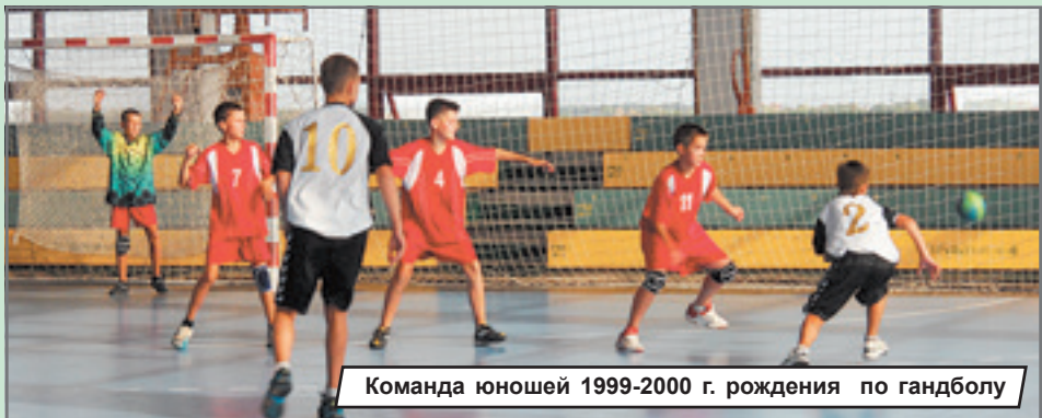
Команда юношей 1999-2000 г. рождения по гандболу

Руководители района уверены, что в нашем районе очень много неравнодушных людей, которые думают о том, как развить спорт, как вырастить здоровое поколение.