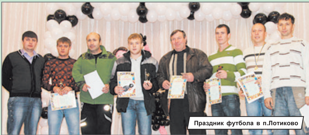
Праздник футбола в п.Лотиково